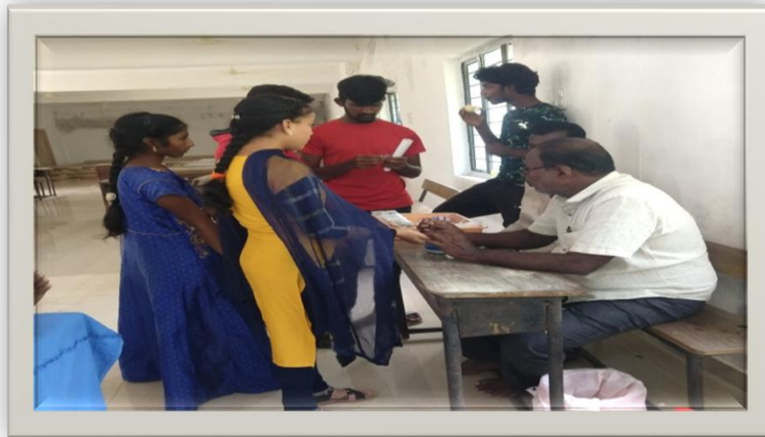
Students giving blood to examine the Hemoglobin percentage