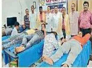
రక్తదానం చేస్తున్న యువత సభ్యులు