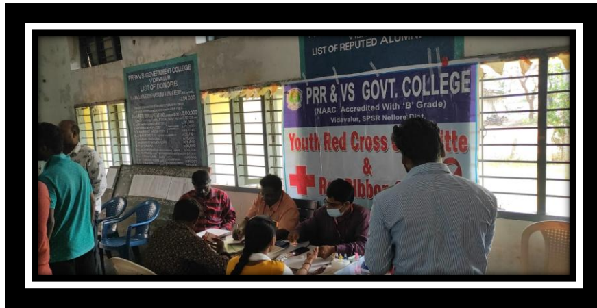
BLOOD GROUPING TO STUDENTS

B. S. PRINCIPAL PRR & VS GOVT. COLLEGE VIDAVALUR - 524318. SPSR NELLORE DT.