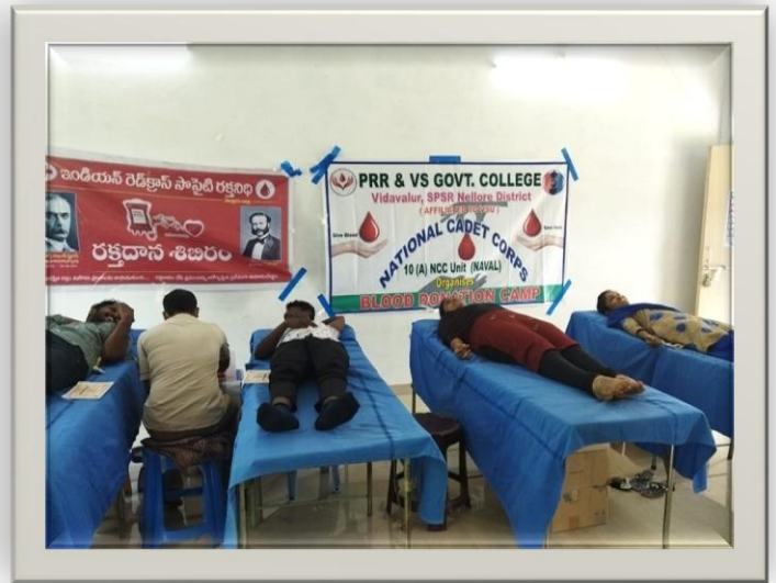
Blood Donation by our students